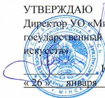
ГРАФИК учебного процесса на II полугодие 2023/2024 уч.г.